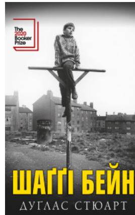
Шаггі Бейн: роман