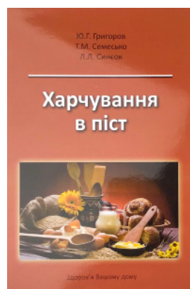
Харчування в піст