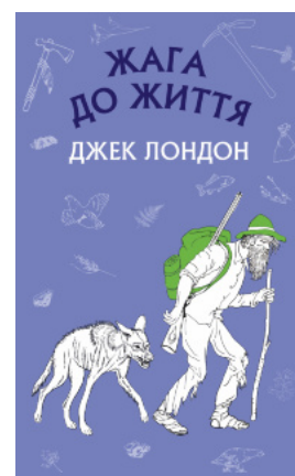
Жага до життя: збірка оповідань

Перейти до категорії Науково-популярна медицина