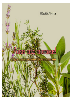
Ліки під ногами! Про лікування рослинами