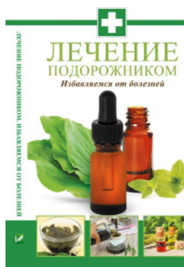
Лечение подорожником. Избавляемся от болезней