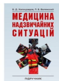
Медицина надзвичайних ситуацій