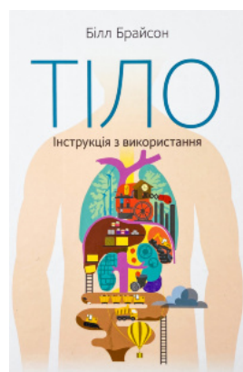
Тіло. Інструкція з використання