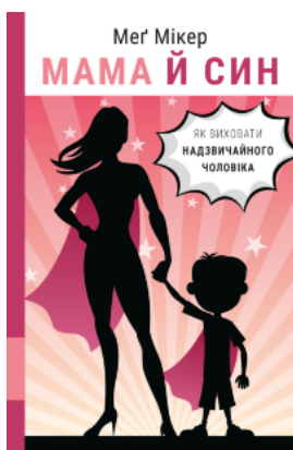
Мама й син. Як виховати надзвичайного чоловіка