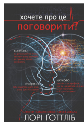
Хочете про це поговорити?. Нотатки психотерапевта в 58 сеансах