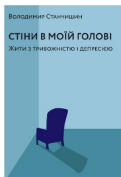
Стіни в моїй голові. Жити з тривожністю і депресією