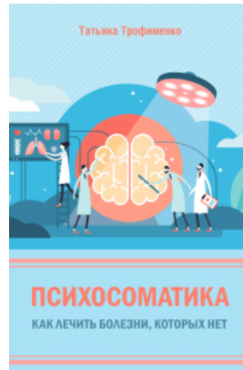
Психосоматика. Как лечить болезни, которых нет