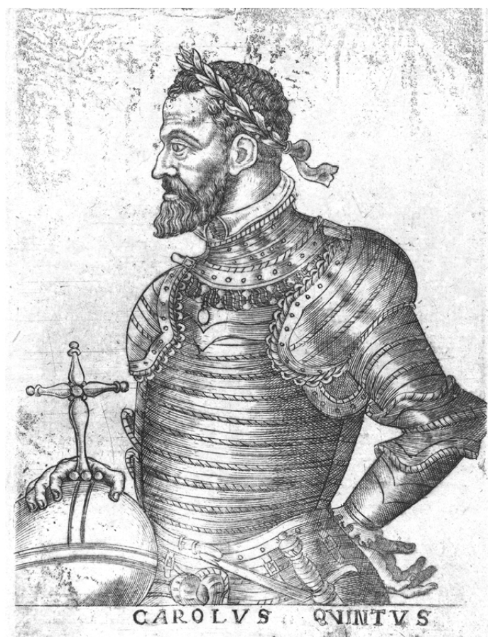
Карл V, рисунок Вермеена Яна Корнелиса, XVI век

А еще Карл воевал с турками — под Веной, в Венгрии, в Тунисе и Алжире, получив за это прозвище Божий знаменосец, активно участвовал в войнах на территории Германии, где лютеранские аристократы сходились в кровавых схватках с католическими правителями. Именно о религиозные войны разбилась мечта Карла о создании империи, которая бы объединила весь континент (уже в XX веке о нем заговорили как об «отце Европы»).