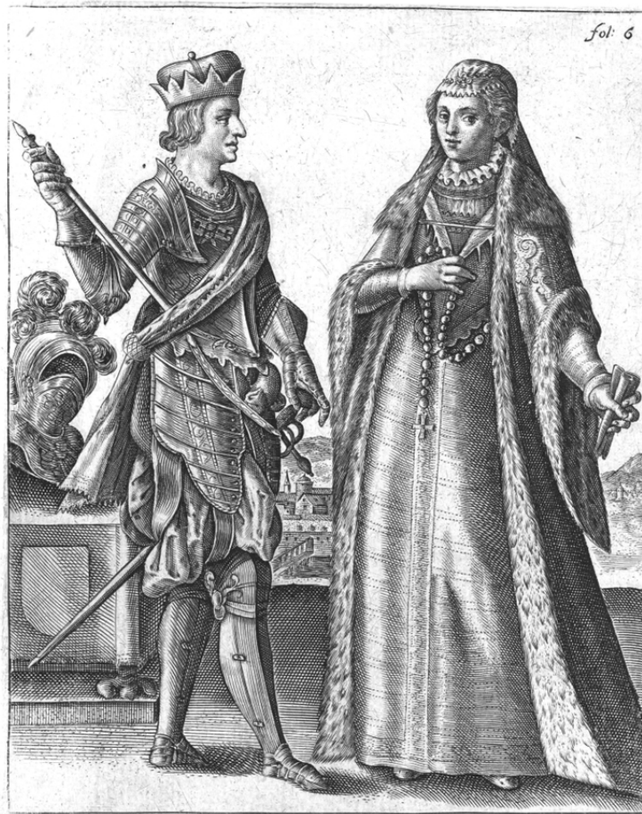
Максимилиан I Габсбург и Мария Бургундская, рисунок начала XVII века

Как свидетельствовали современники, супруги любили друг друга, их отношения были вполне гармоничными, а не основывались просто на трезвом расчете. Максимилиан так описывал внешность своей будущей жены в письме к другу: «Это дама красивая, благочестивая, добродетельная, которой я, благодарение Господу, весьма доволен. Сложением хрупкая, с белоснежной кожей; волосы каштановые, маленький нос, небольшая головка, некрупные черты лица; глаза карие и серые одновременно, ясные и красивые. Нижние веки чуть припухшие, как будто она только что ото сна, но это едва заметно. Губы чуть полноваты, но свежи и алы. Это самая красивая женщина, какую я когда-либо видел». Кстати, благодаря браку представителя Габсбургов с Марией Бургундской к ее потомкам на австрийском