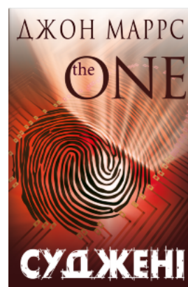
Суджені. The One