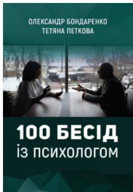
100 бесід із психологом