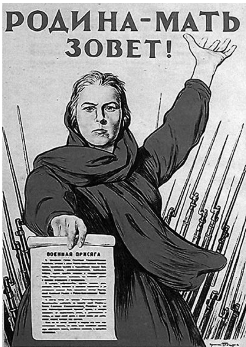
«Батьківщина-мати кличе!» Найвідоміший радянський плакат часів війни, що закликає громадян стати на захист вітчизни, тобто СРСР

«Війну з фашистською Німеччиною не можна вважати війною звичайною. Вона є війною не тільки між двома арміями. Вона є разом з тим великою війною всього радянського народу проти німецько-фашистських військ. Метою цієї всенародної Вітчизняної війни проти фашистських поневолювачів є не тільки ліквідація небезпеки, що нависла над нашою країною, але й допомога всім народам Європи, що стогнуть під ігом німецького фашизму».