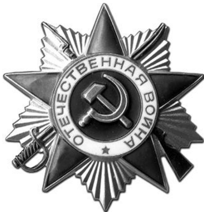
Орден Вітчизняної війни 1-го ступеня — один із візуальних елементів радянського міфу про Велику Вітчизняну війну

Радянська пропаганда дезорієнтувала значну частину радянських громадян, які перестали сприймати Третій Райх як потенційного ворога. На частині території України також залишалася пам'ять про німців взірця 1918 року.