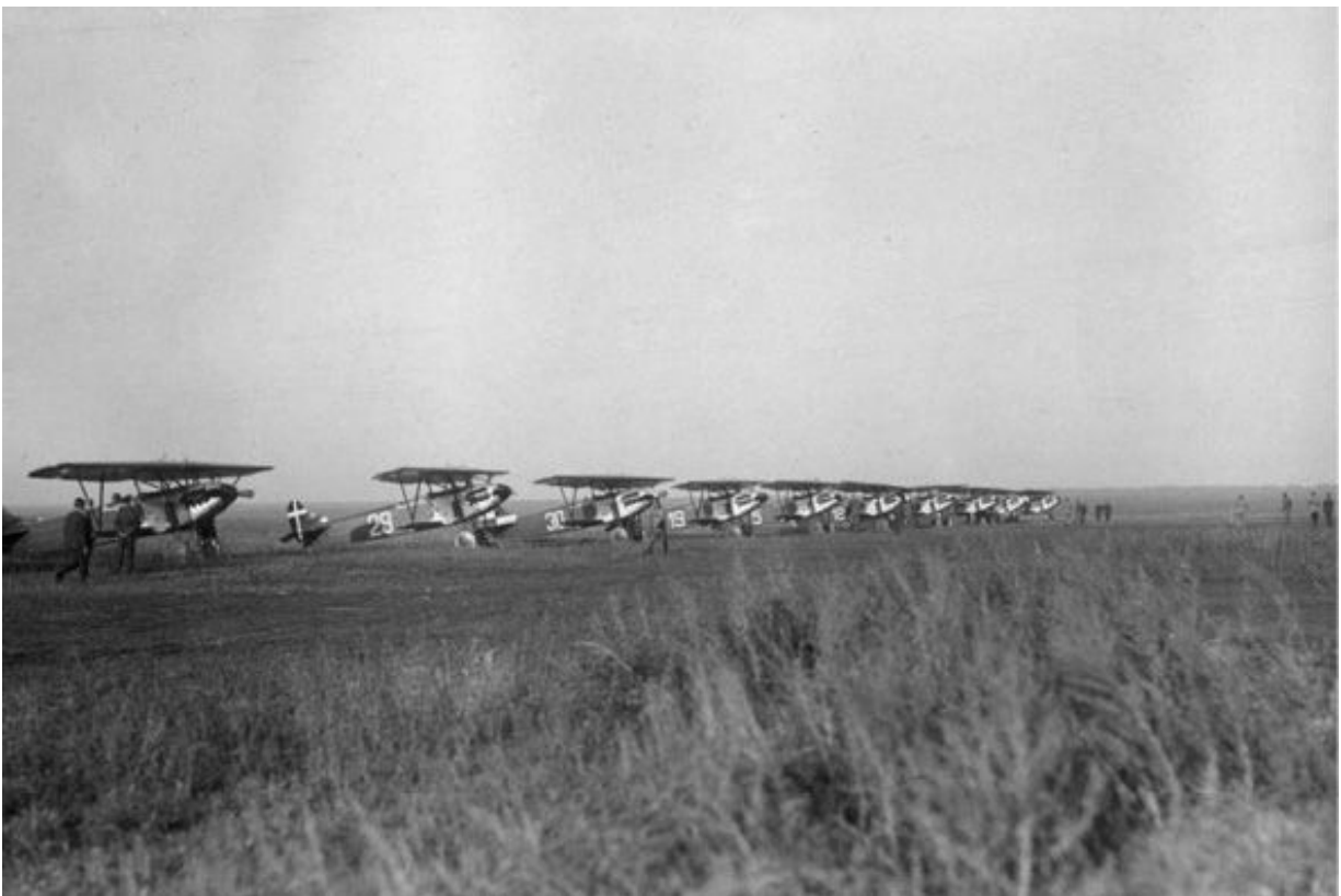
Німецькі літаки «Фоккер D XIII» на летищі в липецькій авіашколі

Співпраця Москви з Німеччиною не обмежувалася урядовими колами. У 1923 році франко-бельгійська окупація Рурської області в Німеччині спричинила радикалізацію опозиції в цій країні. В СРСР розраховували, що хвиля народного гніву в Німеччині переросте у комуністичну революцію. Зважаючи на популярність націоналістичних і пронацистських угруповань, Москва прямо вимагала від Комуністичної партії Німеччини співпрацювати з правими екстремістами.