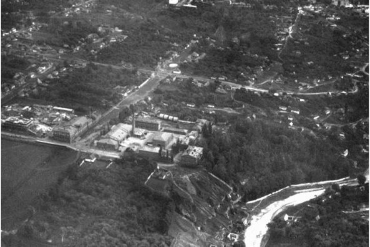
Таємна німецька авіашкола в м. Липецьку з висоти пташиного польоту

Окрім того, держави-переможниці намагалися ізолювати економічно та політично Радянський Союз, оскільки побоювалися комуністичної експансії. Фактором стабільності Європи вважалися нові незалежні держави, такі як Польща, Чехословаччина та інші.