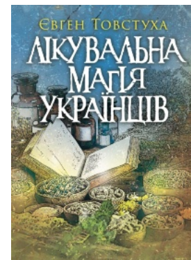
Лікувальна магія українців