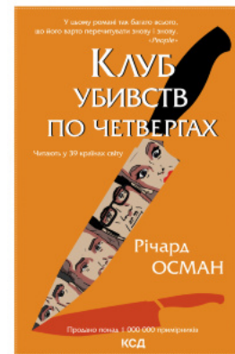
Клуб убивств по четвергах