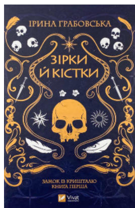
Зірки й кістки