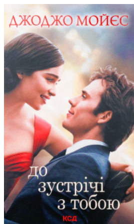
До зустрічі з тобою