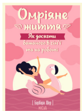
Омріяне життя. Як досягти бажаного в сім'ї та на роботі