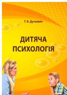
Дитяча психологія. Практикум