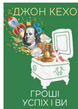
Гроші, успіх і ви

Перейти до категорії Педагогічна психологія