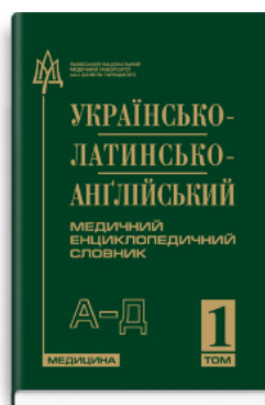
Українсько-латинсько-англійський медичний енциклопедичний словник: у 4 томах. — Том 1. А—Д