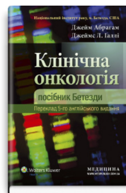
Клінічна онкологія: посібник Бетезди: 5-е видання