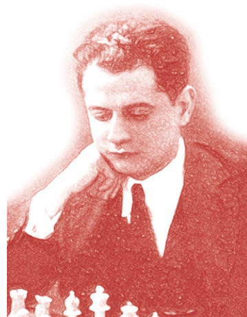
Хосе Рауль Капабланка і Граупера

Чому ж ми назвали цю необхідну передмову «Капабланка і Сухомлинський»?