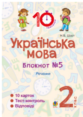
Українська мова. 2 клас. Зошит №5. Речення