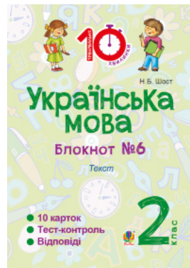
Українська мова. 2 клас. Зошит №6. Текст