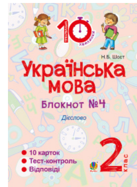
Українська мова. 2 клас. Зошит №4. Дієслово