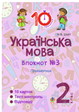
Українська мова. 2 клас. Зошит №3. Прикметник