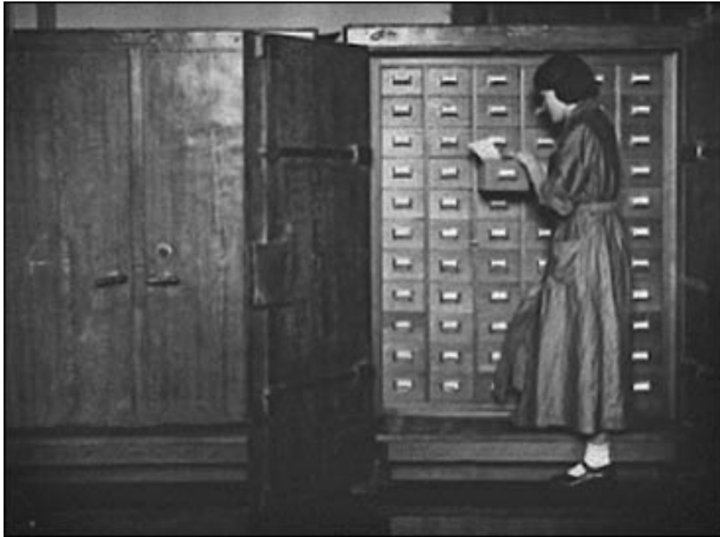
Картоотека відділу архіву НКВД СРСР, 1939 р.

Надзвичайна важливість матеріалів архіву зумовлюється вже їх походженням. Особливістю тоталітарних режимів є прагнення їхніх функціонерів контролювати всі сфери життя людини, а для цього їм потрібно було знати про неї все. Ці завдання покладалися на карально-репресивні органи. Результатом стала величезна кількість зібраних свідчень, спостережень, таємних повідомлень, компрометуючої інформації про осіб, котрі стали об'єктом зацікавлень спецслужб режиму, та про діяльність опозиційних організацій. З іншого боку, органи залишили після себе не меншу кількість приписів, розпоряджень, вказівок, які мали забезпечити їхню роботу та життєздатність самого режиму. Всі ці дані зосереджувалися у спеціальних архівосховищах, доступ до яких особливо ретельно обмежувався. Архіви карально-репресивної системи були серцевиною функціонування тоталітарного механізму.