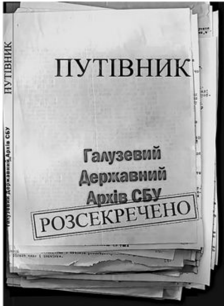
Путівник по матеріалах Архіву СБУ. Видання ГДА СБУ та Харківської правозахисної групи, 2009 р.

Серед оперативно-розшукових — справи на ключових осіб культурної та політичної історії України минулого століття: Михайла Грушевського, Миколу Бажана, Андрія Малишка, Володимира Сосюру, Павла Тичину, Максима Рильського, Юрія Яновського, Остапа Вишню, Олександра Довженка, Дмитра Клячківського, Романа Шухевича, Василя Кука, групова справа на провід ОУН в Україні «Берлога» та багато інших. Ще донедавна ніхто, крім співробітників архіву, і не знав про