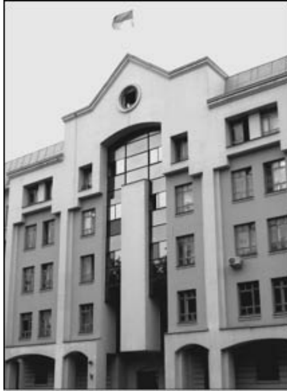
Будівля Галузевого державного архіву СБУ. Київ, вул. Золотоворітська, 7

Специфікою України у цьому випадку залишається, на жаль, притаманна і в багатьох інших сферах недовершеність певних починань. Ще у вересні 1991 року розпочато передання документів архіву в обласні державні архіви. Протягом кількох років передано понад 1,5 мільйона справ, але згодом ця робота з незрозумілих причин зупинилася. Не увінчалися успіхом і спроби створення окремого архіву, здійснені у 2008—2010 роках: Верховною Радою не було прийнято потрібного для цього закону, Кабінет Міністрів не спромігся на необхідну постанову. Тож основний масив документів залишився у віданні теперішньої спецслужби, і, як показують події останніх років, перетворився на заручника політичної ситуації в країні.