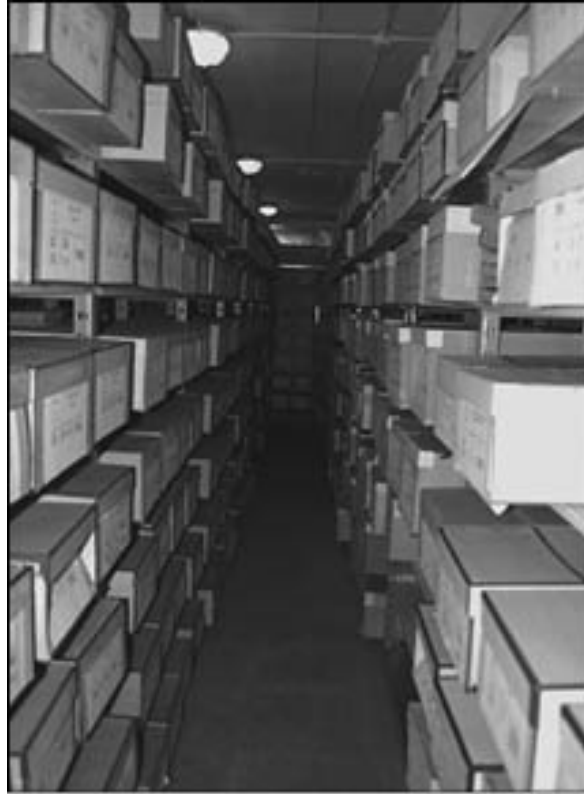
Архівне сховище СБУ, 2008 р.

Наслідком боротьби проти режиму стала також величезна кількість конфіскованих документів організацій та окремих осіб, починаючи від матеріалів повстанських загонів Центральної і Південної України 1920-х років і закінчуючи документами Народного руху України кінця 1980-х — початку 1990-х. Серед цих конфіскацій — унікальна колекція документів ОУН та УПА, про яку йтиметься в окремій статті.