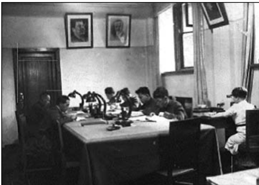
Читальний зал архіву НКВД СРСР, 1939 р.

Тому на сьогодні найцінніші матеріали про методи роботи радянського режиму знаходимо не в збірках документів комуністичної партії, що керувала державою, а саме в архівах комуністичних органів безпеки. Якщо документи партії містять часто прикрашену, ідеологічно витриману інформацію, то в документах ЧК — ГПУ — НКВД — МГБ — КГБ вона подається з граничною відвертістю та навіть цинічністю. Стражі режиму не дозволяли собі «запудрювати мізки», оскільки від чіткого бачення ситуації залежала можливість швидко й ефективно корелювати її.