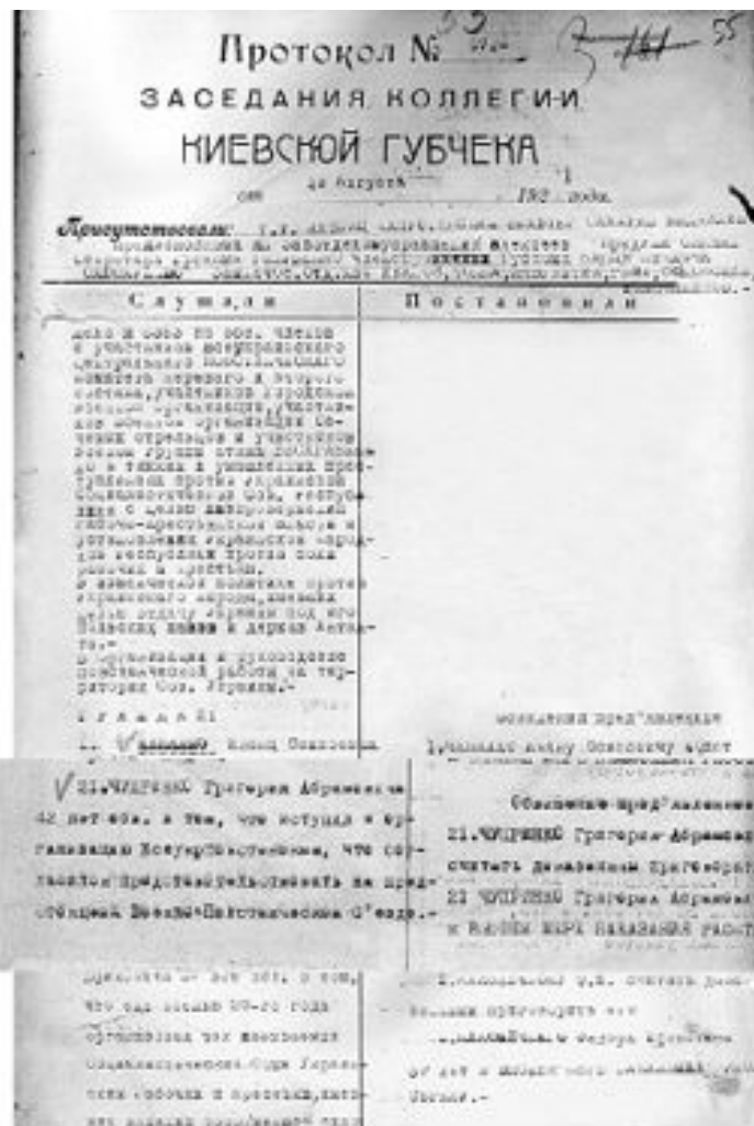
Протокол Київської ЧК з рішенням у справі членів ЦУПКОМУ, 1921 р. Витяг із протоколу