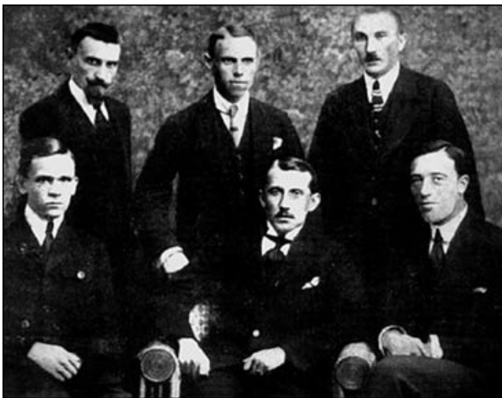
Творці Української військової організації. Нарада Стрілецької ради у Празі, липень 1920 р.

Точну дату створення організації назвати неможливо — вона губиться десь у бурхливих подіях 1920—1921 років. І справді, на фоні глобальних змін того часу (підписання Симоном Петлюрою угоди з Польщею і зречення від західноукраїнських земель, спільний наступ та відступ польсько-українського війська, наступ та відступ більшовиків, що мало не захопили Варшави, врешті підписання Ризького договору між Польщею і Радянською Росією, яке поставило крапку на підтримці першою української справи) зустріч невеликої групи офіцерів, які вирішили продовжити боротьбу за незалежність, була непомітною. Тим паче, що, можливо, й не було однієї такої зустрічі чи однієї групи, а організація постала з кількох ініціатив, що згодом об'єдналися.