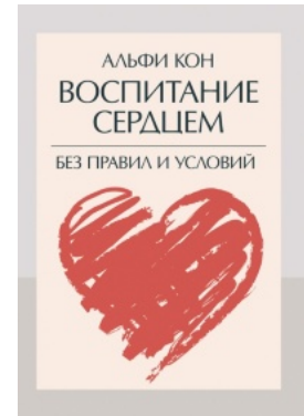
Воспитание сердцем. Без правил и условий