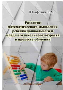
Развитие математического мышления ребенка дошкольного и младшего школьного возраста в процессе обучения