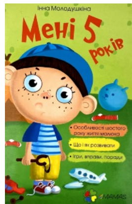
Мені 5 років

Перейти до категорії Біографії і мемуари