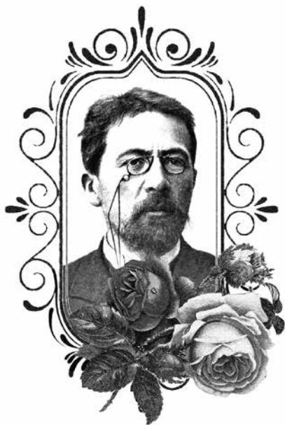
Антон Чехов (1860–1904)