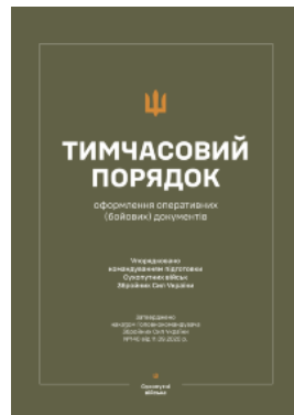
Наказ ГК № 140 — Тимчасовий порядок оформлення оперативних (бойових) документів