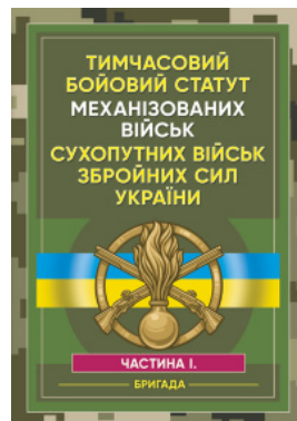
Тимчасовий бойовий статут Механізованих військ сухопутних військ Збройних Сил України. Частина 1 (бригада)