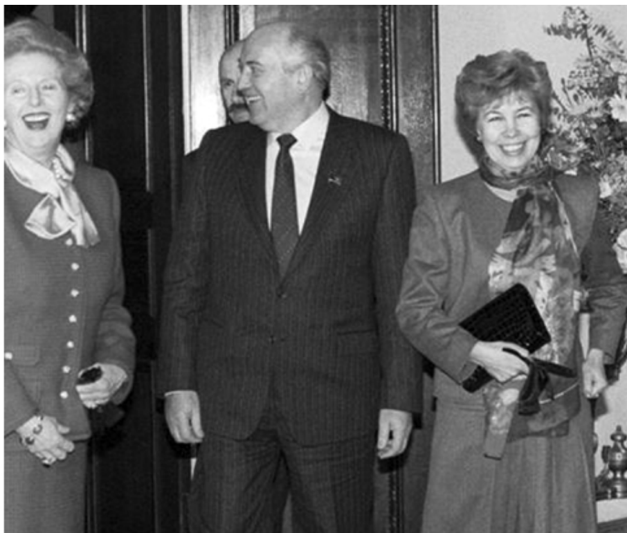
Маргарет Тэтчер и Михаил и Раиса Горбачевы во время визита советского лидера в Британию в 1989 году