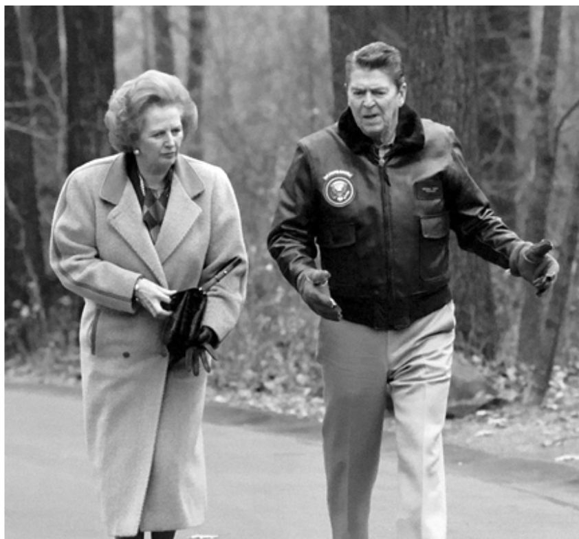
Американский президент Рональд Рейган и Маргарет Тэтчер в загородной резиденции американских президентов Кэмп Дэвид, 1986 год