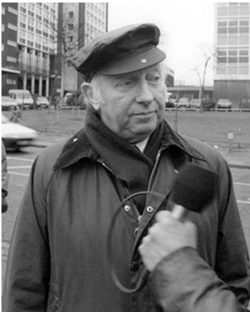
Артур Скаржилл, инициатор забастовки шахтеров