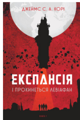
Експансія. Кн. 1