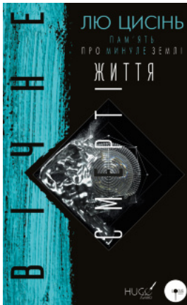
Вічне життя Смерті