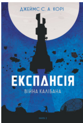
Експансія. Кн. 2