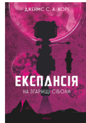
Експансія. Кн.4. На згарищі Сіболи