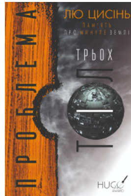
Проблема трьох тіл