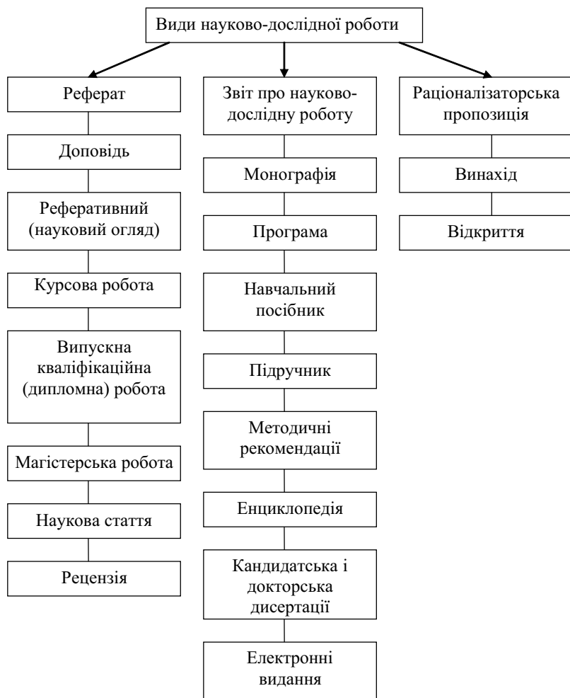
Рис. 1.2. Основні види наукової та науково-методичної роботи

ституту (університету). Але це зазвичай обсяг у межах 10 сторінок комп'ютерного (рукописного) тексту. Бажано, щоб реферат мав спеціально оформлену титульну сторінку і був структурований.