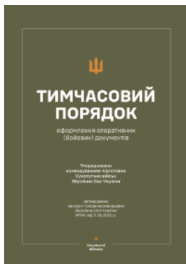
Наказ ГК № 140 — Тимчасовий порядок оформлення оперативних (бойових) документів