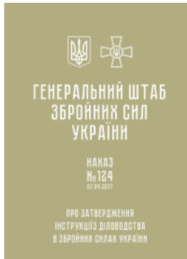
Наказ ГШ ЗСУ № 124 — Інструкція з діловодства у Збройних Силах України (2017 рік)