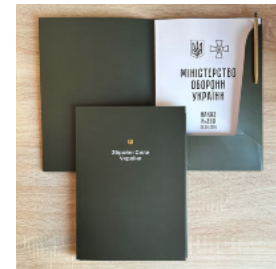
Папка для документів (військовим)