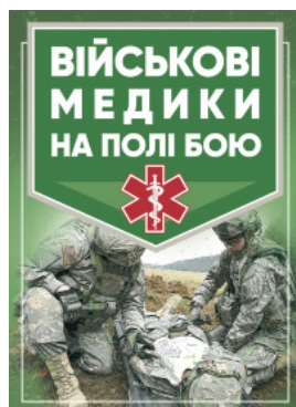
Військові медики на полі бою