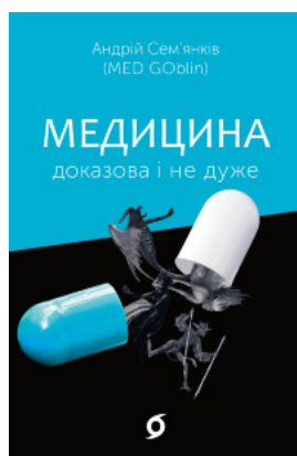
Медицина доказова і не дуже