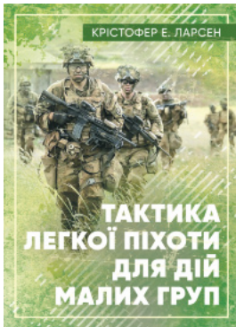
Тактика легкої піхоти для дій малих груп