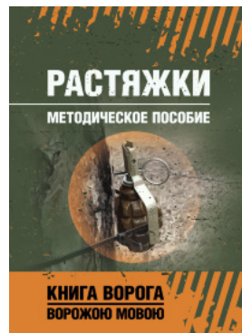
Растяжки. Методическое пособие