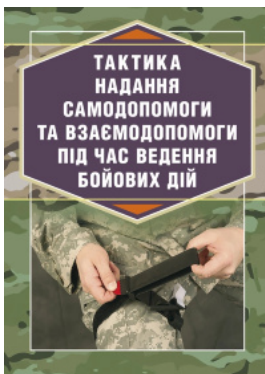
Тактика надання самопоміги та взаємодопоміги під час ведення бойових дій