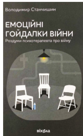
Емоційні гойдалки війни. Роздуми психотерапевта про війну