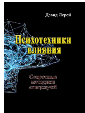
Психотехники влияния. Секретные методики спецслужб