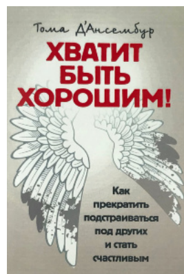
Хватит быть хорошим! Как перестать подстраиваться под других и стать счастливым.