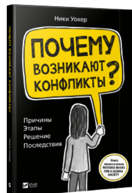
Почему возникают конфликты? Причины. Этапы. Решение. Последствия.