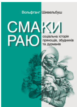
Смаки раю. Соціальна історія прянощів, збудників та дурманів