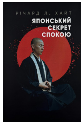
Японський секрет спокою