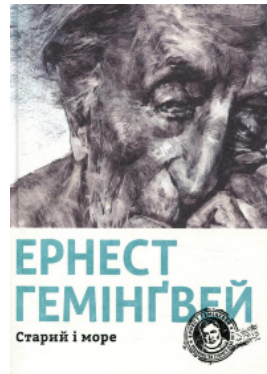
Старий і море