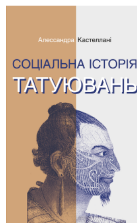
Соціальна історія татувань