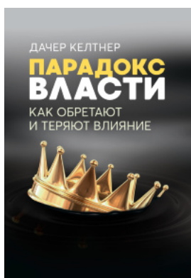
Парадокс власти. Как обретают и теряют влияние