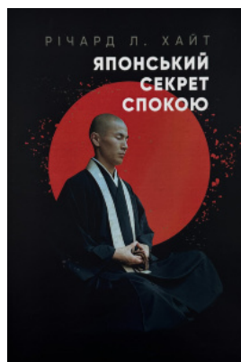
Японський секрет спокою