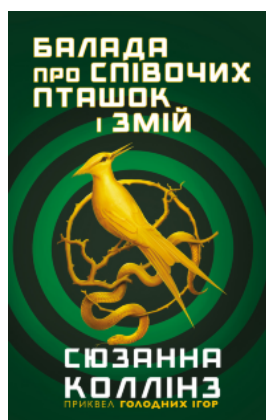
Балада про співочих пташок і змій