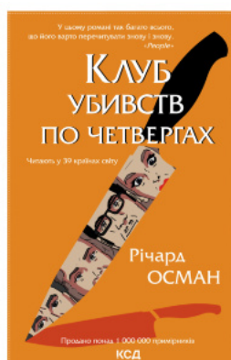
Клуб убивств по четвергах