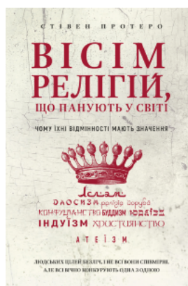
Вісім релігій, що панують у світі. Чому їхні відмінності мають значення