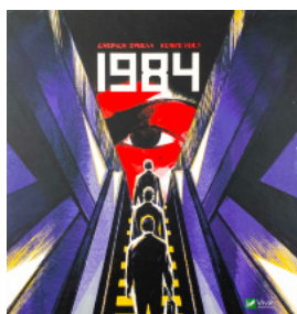
1984. Графічний роман