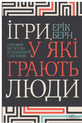
Ігри, у які грають люди