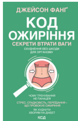
Код ожиріння. Секрети втрати ваги