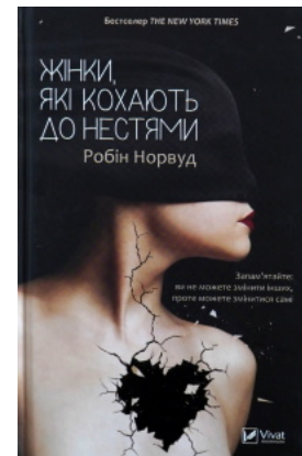
Жінки, які кохають до нестями