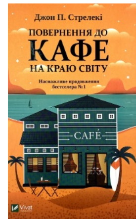
Повернення до кафе на краю світу