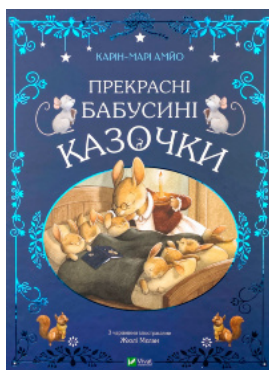
Прекрасні бабусині казочки