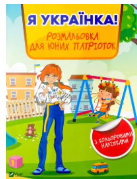
Я українка! Розмальовка для юних патріоток