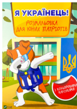
Я українець! Розмальовка для юних патріотів