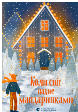
Коли сніг пахне мандаринками