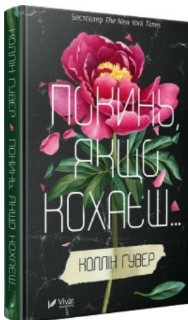
Покинь якщо кохаєш