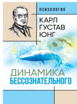
Динамика бессознательного: [сборник]