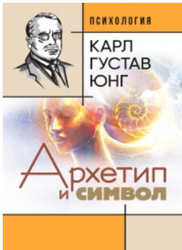
Архетип и символ