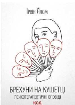
Брехуни на кушетці. Психотерапевтичні оповіді