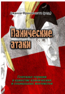
Панические атаки (Гештальт-терапия в единстве клинических и социальных контекстов)