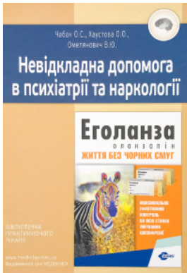
Невідкладна допомога в психіатрії та наркології