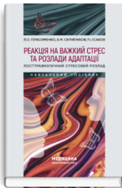
Реакція на важкий стрес та розлади адаптації. Посттравматичний стресовий розлад: навчальний посібник

Перейти до категорії Психіатрія. Наркологія