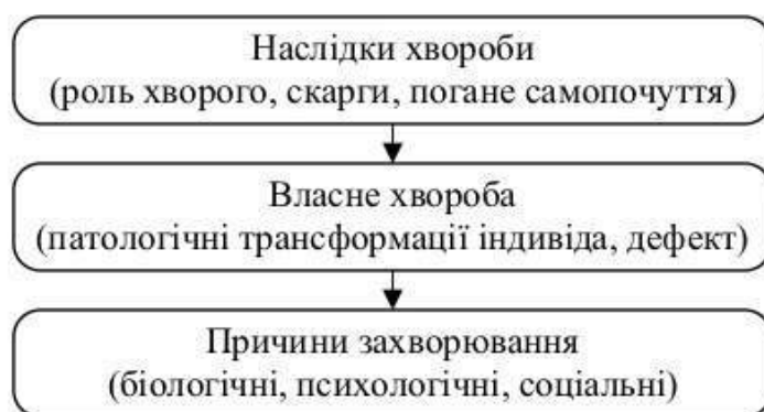
Рис. 1. Психологічний конструкт хвороби

Поняття хвороби — це не стільки відображення об'єктивного стану людини, скільки загальний теоретичний і соціальний конструкт, за допомогою якого намагаються дати визначення порушенням здоров'я, що виникають. Конструкт хвороби, що існує в європейській культурі, передбачає таку послідовність: «причина — дефект — клінічна картина — наслідки» (рис. 1).