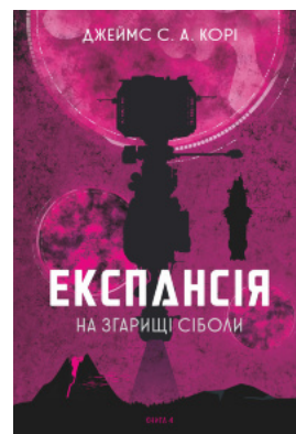
Експансія. Кн.4. На згарищі Сіболи