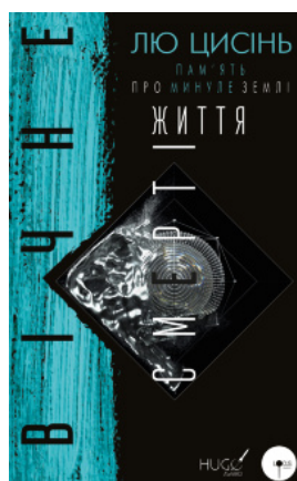
Вічне життя Смерті