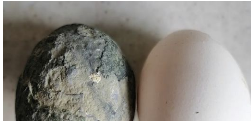
Буцімто скам'яніле яйце рептилії

торговельній платформі — отже, ніхто не був обманутий та не потрапив до лап шахраїв.