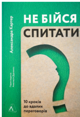
Не бійся спитати. 10 кроків до вдалих переговорів