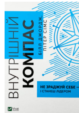
Внутрішній компас: не зраджуй себе — і станеш лідером