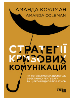
Стратегії кризових комунікацій