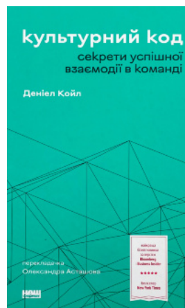
Культурний код. Секрети успішної взаємодії в команді