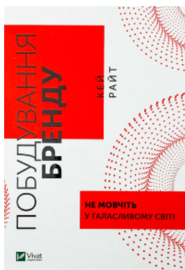
Побудування бренду: не мовчіть у галасливому світі