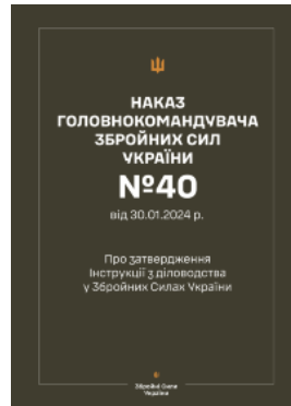
Наказ ГШ ЗСУ № 40 — Інструкція з діловодства у Збройних Силах України (2024 рік)