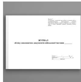
Журнал обліку виконавчих документів військової частини. Додаток 7