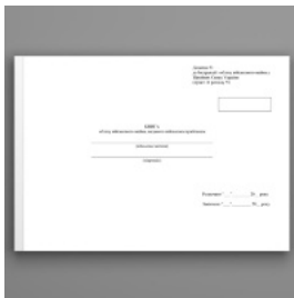
Книга обліку військового майна виданого військовослужбовцям, додаток 53