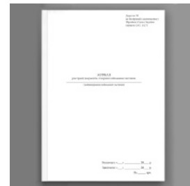
Журнал реєстрації документів створених військовою частиною, додаток 39