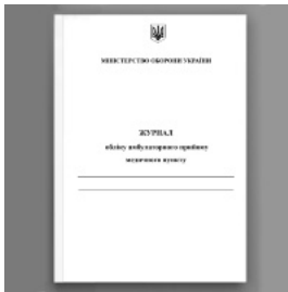
Журнал обліку амбулаторного прийому медичного пункту