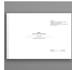
Книга обліку втрат військового майна, додаток 6

Перейти до категорії Книги обліку для військових