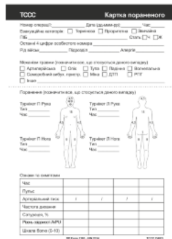
Медична картка пораненого ТССС А5