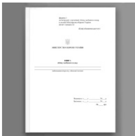
Книга обліку особового складу, додаток 3