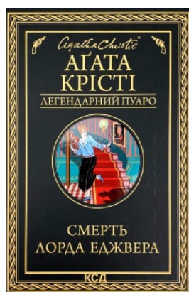
Смерть лорда Еджвера