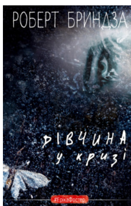
Дівчина у кризі. Детективний роман про Еріку Фостер