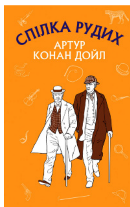
Спілка рудих. Пістрява стрічка