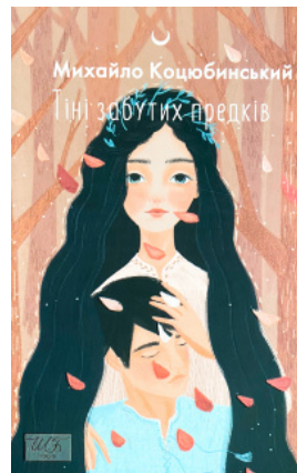
Тіні забутих предків