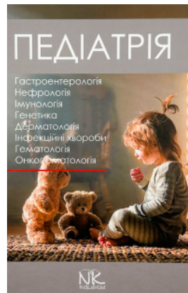
Педіатрія. Том 2