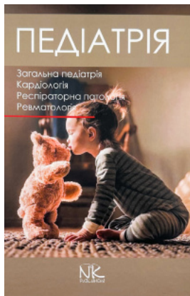
Педіатрія. Том 1