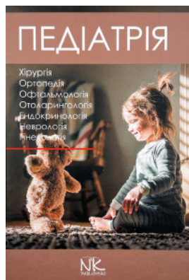
Педіатрія. Том 3