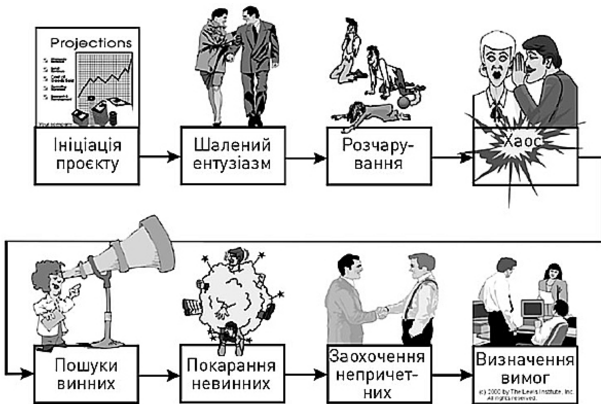
Рис. 1.2. Життєвий цикл проблемного проєкту

Я демонстрував цей рисунок людям у багатьох країнах — і вони незмінно сміялися та казали: «Саме так усе й відбувається». У цій ситуації мене заспокоює те, що ми, американці, не єдині, хто стикається з подібною проблемою, однак є й погана новина — якщо всі визнають цю модель, то існує багато неадекватних проєктів.