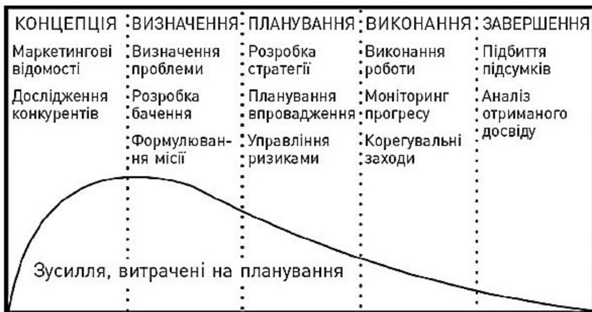
Рис. 1.3. Правильний життєвий цикл проєкту

Поглянувши на мою модель, ви помітите: кожен проєкт починається як концепція, що завжди є «нечіткою», і проєктна команда повинна сформулювати визначення роботи, перш ніж братися до її виконання. Однак, ураховуючи наш менталітет «готовності йти в бій», ми часто беремося до роботи, не впевнившись, що маємо правильне визначення цілі або що всі поділяють місію та бачення цієї роботи. Це незмінно призводить до серйозних проблем в процесі розвитку проєкту. Для розуміння наведу наступний приклад.