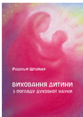
Виховання дитини з погляду духовної науки