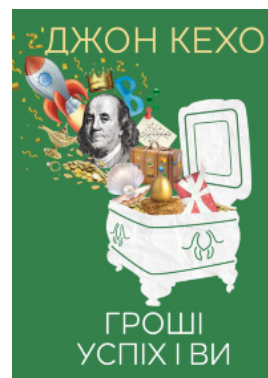
Гроші, успіх і ви

Перейти до категорії Саморозвиток та мотивація