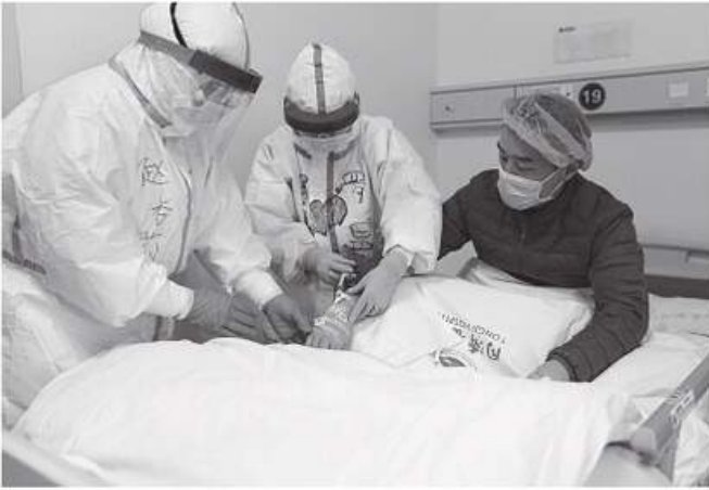
РИС. 11.4. Проведення маніпуляцій інфікованому Covid-19 хворому

дані щодо професійної захворюваності, що пов'язано з неякісним проведенням медичних оглядів та самолікуванням більшості медичних працівників.