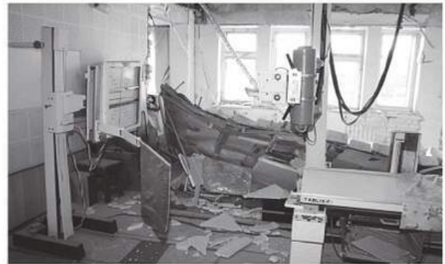
РИС. 11.5. Наслідки вибуху балону з киснево-повітряною сумішшю у Луганській міській лікарні № 7