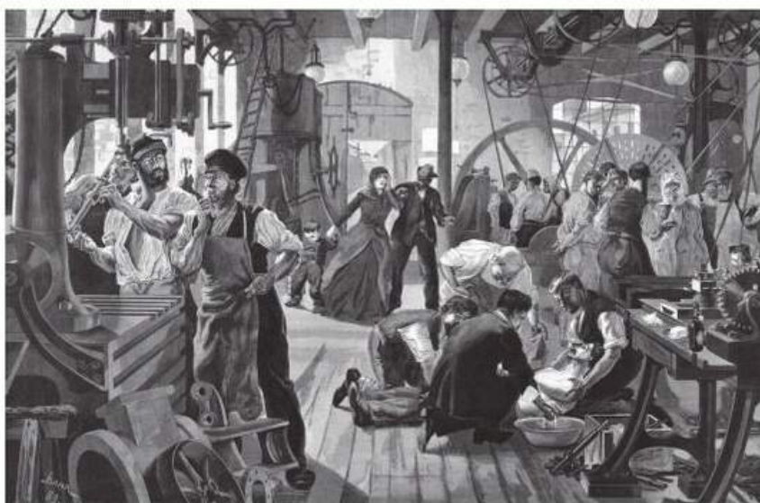
РИС. 11.1. Виробничий нещасний випадок (Йоган Бар, 1889)

Професії медичної спрямованості є одними з найбільш затребуваних та перспективних. При цьому серед усіх видів інтелектуальної праці робота медичних працівників є однією з найбільш небезпечних. Медичний персонал під час виконання своїх професійних обов'язків може підлягати одночасному впливу декількох шкідливих і небезпечних чинників різноманітного походження, що обумовлює потенційний ризик нещасних випадків, професійних захворювань, травмвань та ін. Високий рівень небезпеки наявний і під час експлуатації медичного обладнання, поводження з медичними відходами, зберігання та використання дезінфікуючих засобів, проведення поточного та генерального прибирання, санації повітря, в інших ситуаціях тощо (рис. 11.2).