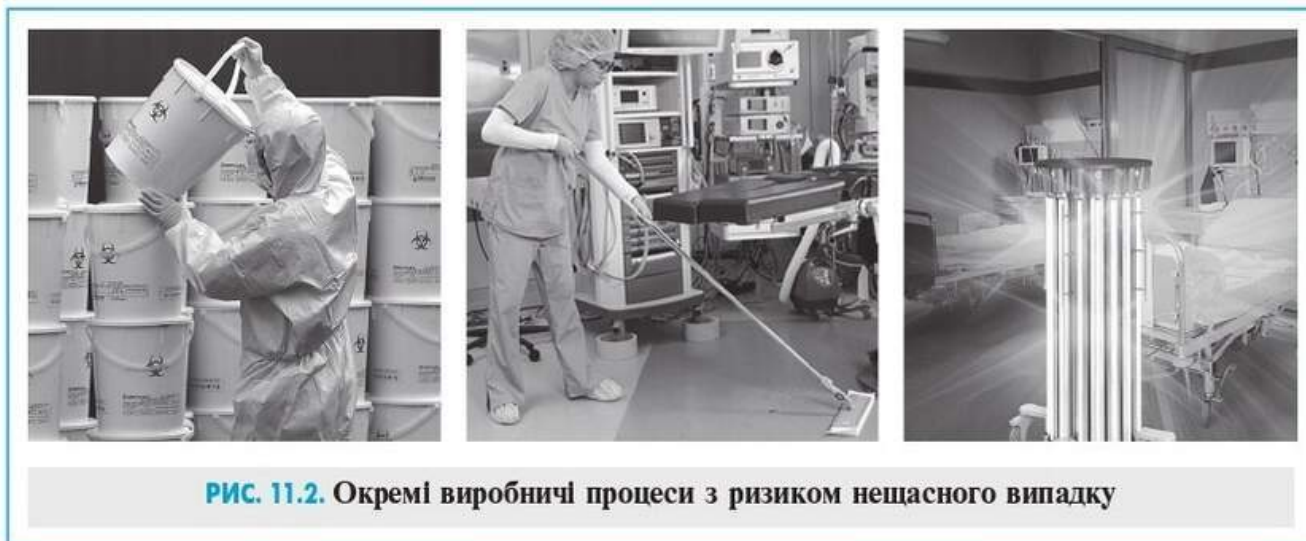
РИС. 11.2. Окремі виробничі процеси з ризиком нещасного випадку