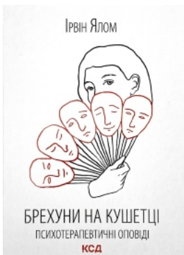
Брехуни на кушетці. Психотерапевтичні оповіді